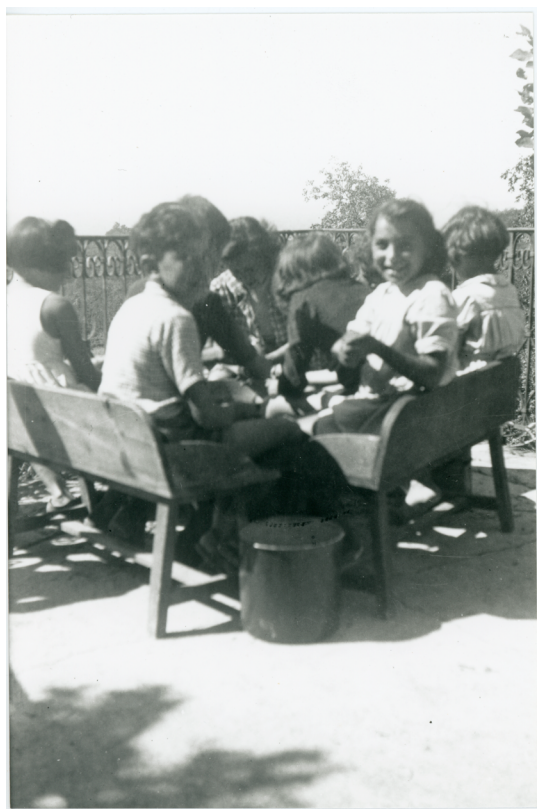
Colonie d'Izieu, été 1943. Pluches sur la terrasse.