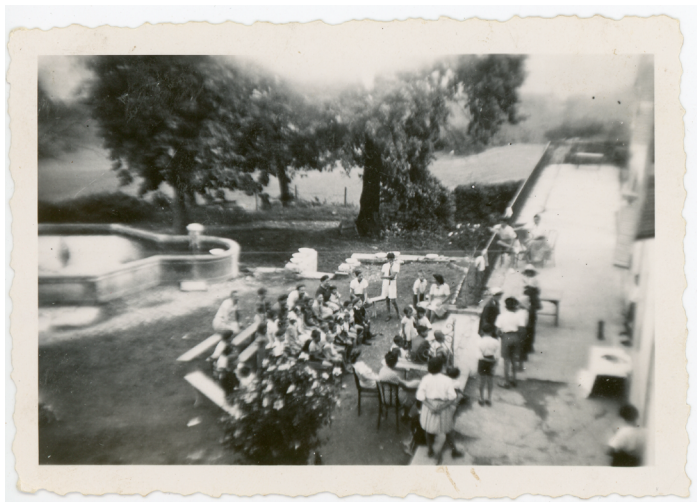
Colonie d'Izieu, été 1943. Une représentation théâtrale. La terrasse servait de scène.